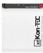
Montaż na podłodze