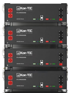
Montaż w stosie / szafie rack