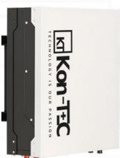
Montaż na ścianie