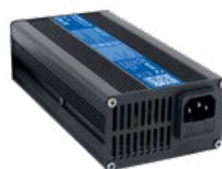
Ładowarka DL-400 12 V 20 A