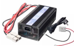
Ładowarka XT-70 12 V 20 A