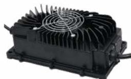
Ładowarka DL-600WP 24 V 18 A