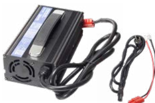
Ładowarka XT-80 24 V 20 A