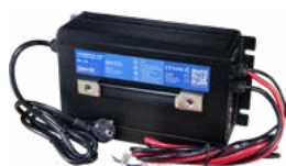
Ładowarka DL-2000 24 V 50 A