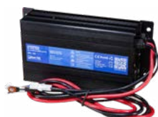
Ładowarka DL-900 12 V 40 A