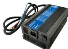
Ładowarka DL-900 24 V 20 A