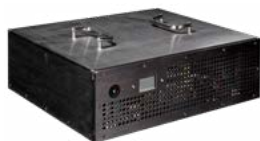
Ładowarka DL-4000 48 V 50 A