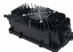
Ładowarka DL-300WP 12 V 15 A