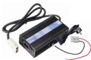
Ładowarka XT-30 12 V 10 A