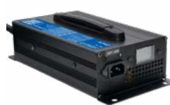
Ładowarka DL-1200 48V 20A