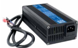
Ładowarka DL-240 12 V 10 A