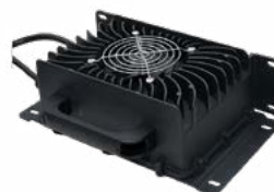
Ładowarka DL-1200WP 48 V 18 A