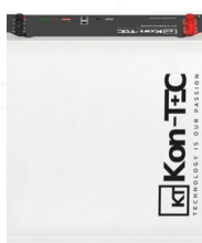
Montaż na podłodze