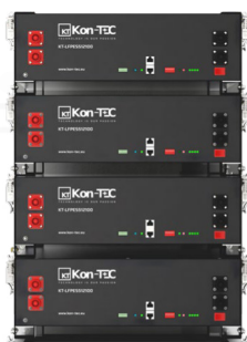
Montaż w stosie / szafie rack